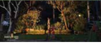
Salón La Casona