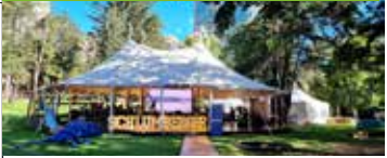
Salón Casa Parque