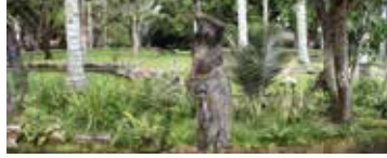
Salón La Casona